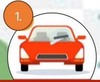
1. เปิดที่ปัดน้ำฝน