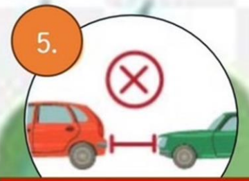
5. ไม่จับชิดคันหน้า