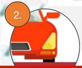
2. เปิดไฟหน้ารถ