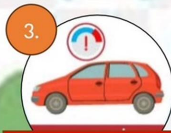
3. ลดความเร็ว