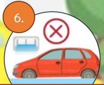
6. หลีกเลียงจุดที่มีน้ำขัง