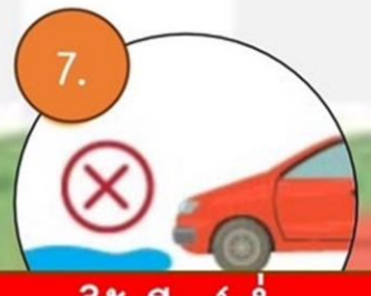
7. ใช้เกียร์ต่ำ เมื่อเจอหน้าท่วม