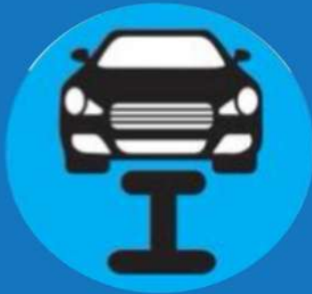
ตรวจสอบเช็คลมยางอย่างสม่ำเสมอ