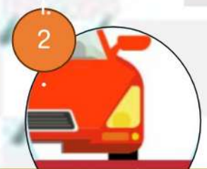
2. เปิดไฟหน้ารถ