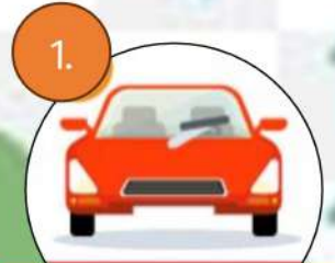
1. เปิดที่ปัดน้ำฝน