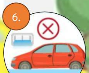
6. หลีกเลี่ยงจุดที่มีน้ำขัง