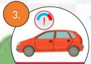
3. ลดความเร็ว