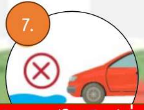
7. ปิดแอร์ใช้เกียร์ต่ำเมื่อเจอหน้าท่วม