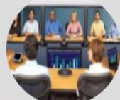
Connect to CAT conference